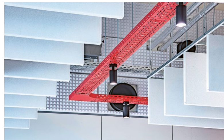
Typografische Statements und kräftige Farbakzente unterstützen das kreative Mindset des Forschungszentrums.